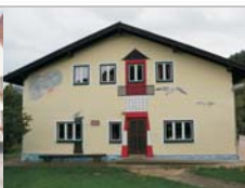
Marienheim Gruppe Möwe Jonathan