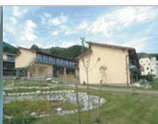
Plateau Basketballplatz / Pausenhof