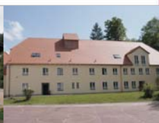
Salesianum Internat / Heim