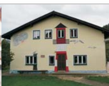
Marienheim Gruppe Möwe Jonathan