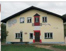
Marienheim Gruppe Möwe Jonathan