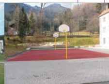
Plateau Basketballplatz / Pausenhof