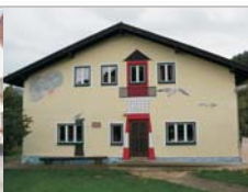
Marienheim Gruppe Möwe Jonathan