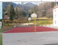
Plateau Basketballplatz / Pausenhof